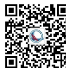
深圳高质量发展与新结构研究院