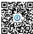
宁波新结构经济学研究中心